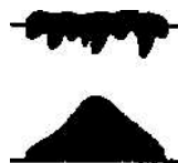
Рис. 2. Формы колоний (вид сбоку)

Описание колонии часто дополняют характером роста микроорганизмов по штриху на поверхности скошенной плотной питательной среды. При этом отмечают его интенсивность — скудный, умеренный, обильный и особенности — налет сплошной с ровным или волнистым краем, четко видный в виде цепочки изолированных колоний, диффузный, перистый, древовидный или ризоидный.